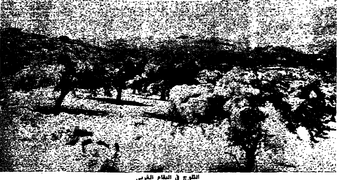
الشلوج في البقاع الغربي